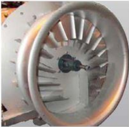
Rectificatoare de aer